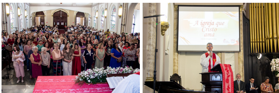
Oração de intercessão e gratidão pelas mulheres