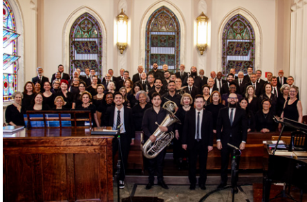
Participação do Coro Reunido e Orquestra de Sopros