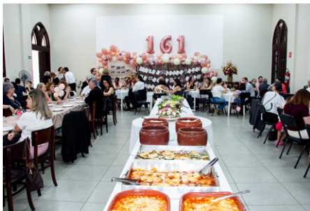
Almoço de confraternização