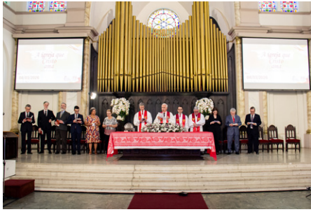
Conselho e igreja prestam louvor a Deus