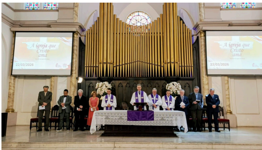
Irmãos da Comissão de Exame de Contas de 2025 estiveram à frente durante o culto.

Domingo (22/03) a Primeira Igreja esteve reunida em assembleia ordinária para aprovação das contas de 2025 (veja ata no editorial) e nomeação de nova comissão de exame de contas para 2026. Assinaram a lista de presença 142 membros e tudo transcorreu de forma tranquila. Este é um ato que consta da Constituição da Igreja Presbiteriana Independente do Brasil (Art. 14, Inciso I). Leia a ata e, se você tiver alteração ou sugestão, envie para o email secretaria@catedralonline.com.br até o dia 30/03, segunda-feira.